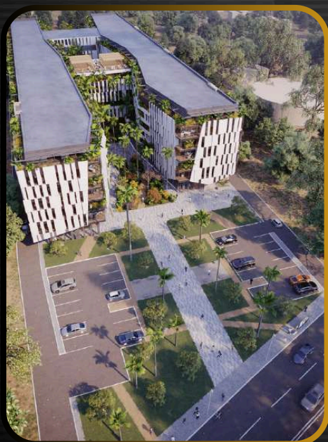
ESPACES DE BUREAUX MODULABLES ET LUMINEUX

Doté de toutes les commodités professionnelles, West Park Offices saura répondre à vos besoins pour favoriser le succès de votre entreprise.