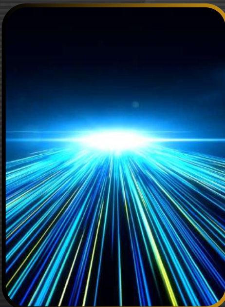
CONNEXION INTERNET HAUT DÉBIT