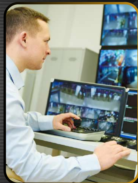
SÉCURITÉ 24/7 AVEC SURVEILLANCE VIDÉO